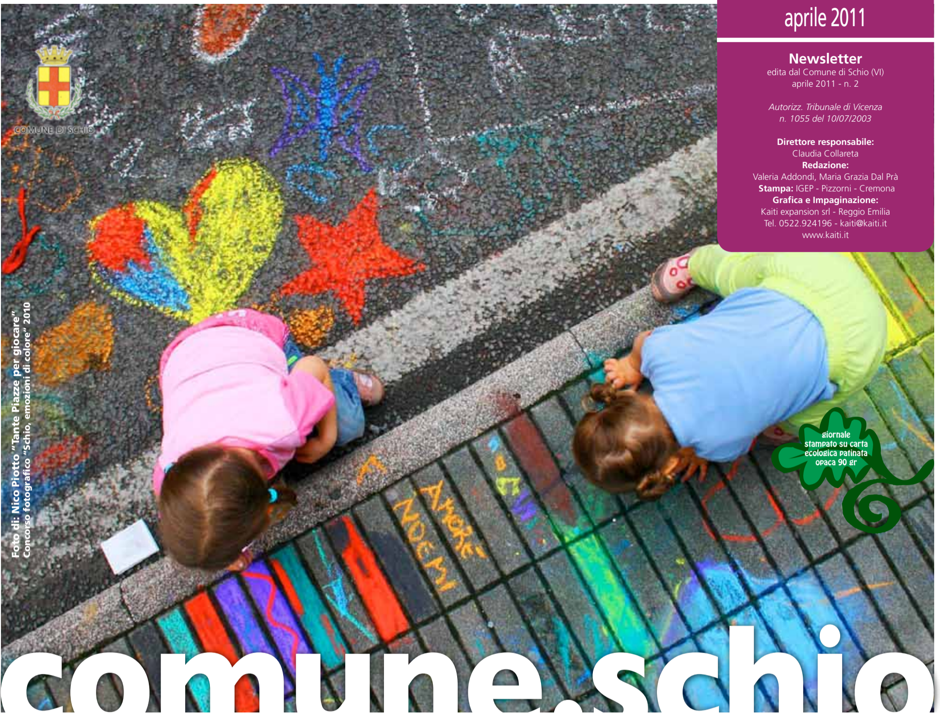
Foto di Nico Piatto "Iante Piazze per giocare" Concorso fotografico "Schio, emozioni di colore" 2010

Grafica e Impaginazione: Kaiti expansion srl - Reggio Emilia Tel. 0522.924196 - kaiti@kaiti.it www.kaiti.it